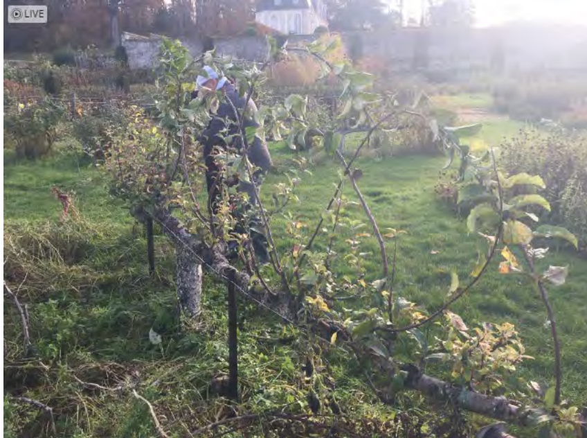
Nouvelle forme cordon Valmer ! Juin et Novembre