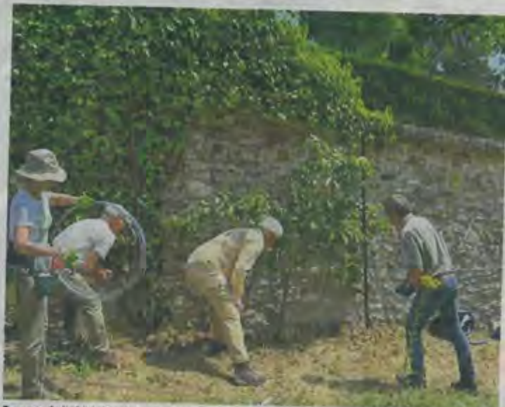
Passage de l'Abbé-Picard, les 6 arbres fruitiers sont restaurés par les Amis du Potager du Roi.